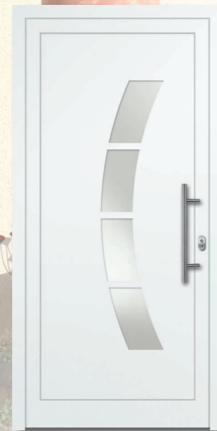
Oewi 07 Aluminium-Füllung VSG Satinato (matt foliert) – Ug1,1