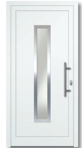
Oewi 06 Aluminium-Füllung Ornamentrahmen Edelstahloptik (Alu-Nox) beidseitig VSG Satinato (matt foliert) – Ug1,1