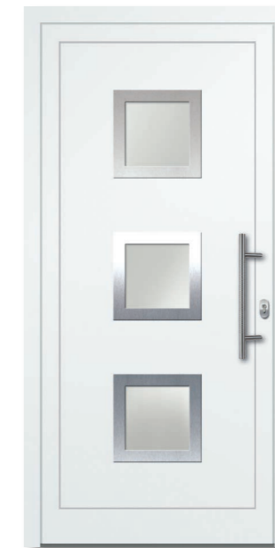
Oewi 22 Aluminium-Füllung Ornamentrahmen Edelstahloptik (Alu-Nox) beidseitig VSG Satinato (matt foliert) – Ug1,1