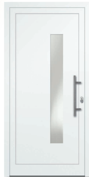
Oewi 08 Aluminium-Füllung VSG Satinato (matt foliert) – Ug1,1