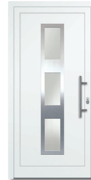
Oewi 04 Aluminium-Füllung Ornamentrahmen Edelstahloptik (Alu-Nox) beidseitig VSG Satinato (matt foliert) – Ug1,1