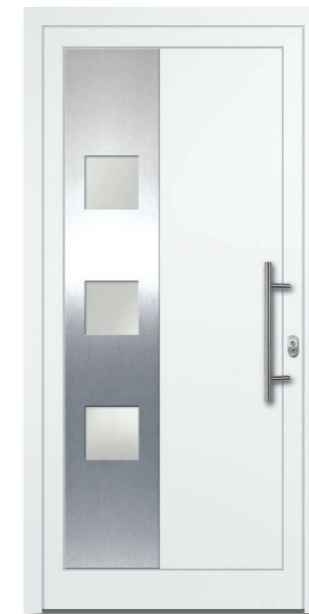
Oewi 21 Aluminium-Füllung Ornamentrahmen Edelstahloptik (Alu-Nox) beidseitig VSG Satinato (matt foliert) – Ug1,1