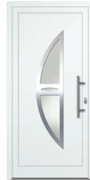
Oewi 03 Aluminium-Füllung Ornamentrahmen Edelstahloptik (Alu-Nox) beidseitig VSG Satinato (matt foliert) – Ug1,1