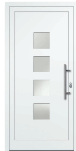
Oewi 20 Aluminium-Füllung VSG Satinato (matt foliert) – Ug1,1