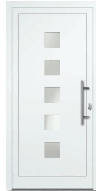
Oewi 02 Aluminium-Füllung VSG Satinato (matt foliert) – Ug1,1