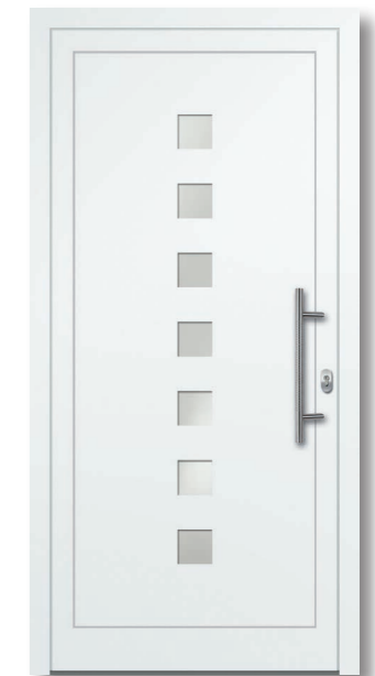
Oewi 24 Aluminium-Füllung VSG Satinato (matt foliert) – Ug1,1